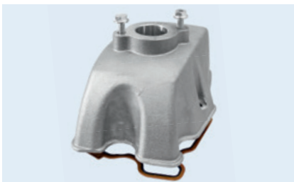
Ventildeckel mit Flanschaufnahme und -Dichtung