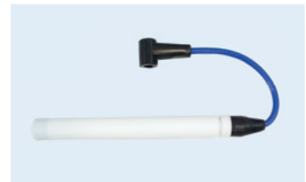
PolyMot™-Zündleitung mit Nut für Sicherungsflansche