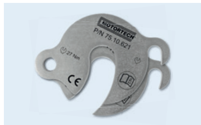
Sicherungsflanschsatz für Zündleitung