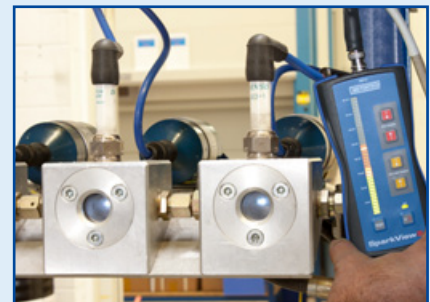
Druck- und Funktionsprüfungen