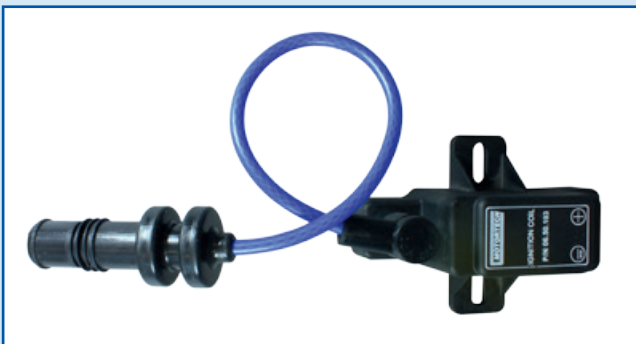
导线材质为柔性硅胶