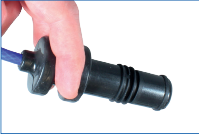
安装导线时，无须拆卸其套筒