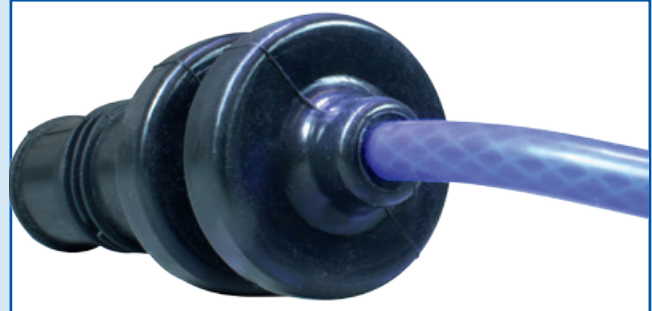
改进密封性，防止漏水进入套筒内