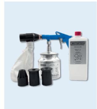
火花塞清洗装置 P/N 44.01.023