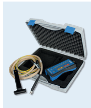
SparkView 高压指示器 P/N 06.50.099-100