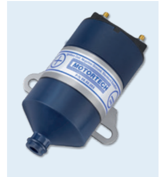
点火线圈 P/N 06.50.055