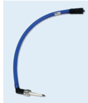
非屏蔽式安全引线 P/N 09.02.4001-20