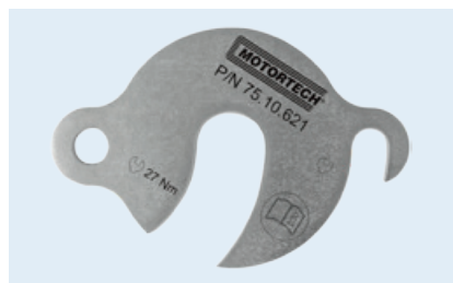
Sicherungsflansch für Zündleitung