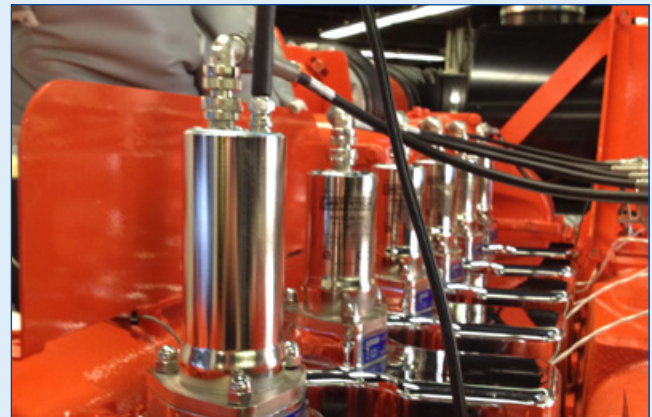
* Высоковольтные катушки MOTORTECH с монтажным фланцем и с разъемом диагностики