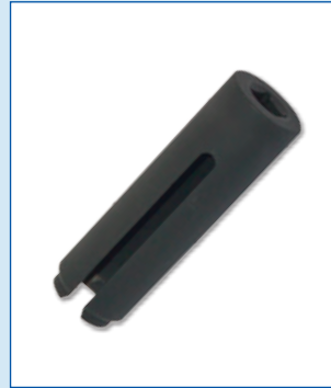
火花塞套筒 P/N 07.99.022-6-2