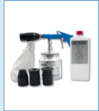
火花塞清洁套件 P/N 44.01.023