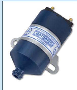
点火线圈 P/N 06.50.055