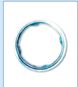
火花塞垫圈, M18 P/N 06.50.099-100