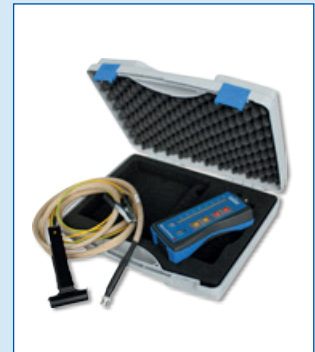
火花塞电压指示器 P/N 06.50.099-100